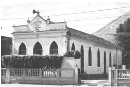
Antigo e Novo templos.

dados levantados da publicação Jubileu de Ouro/1926-1976 e da coleção de boletins